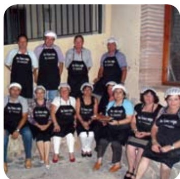
Nuevas asociaciones en el municipio.