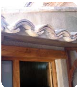
Enate recupera el antiguo Horno.