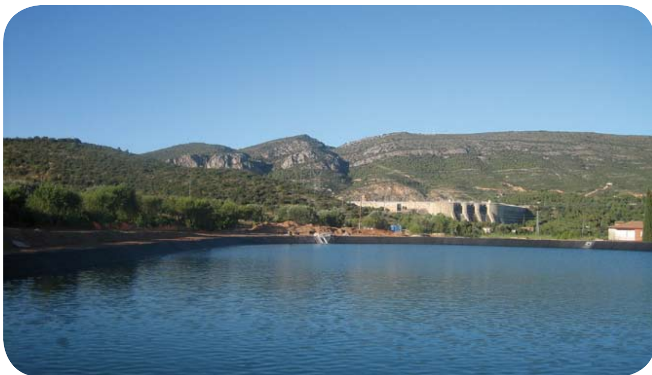
Finalizadas las obras del nuevo depósito de agua de El Grado y la red de abastecimiento del Barrio del Cinca.

ARTASONA - COSCOJUELA DE FANTOVA - EL GRADO - ENATE año 2011 - ENERO