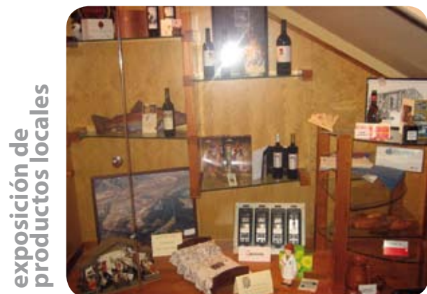
exposición de productos locales

La exposición bajo la escalera del Ayuntamiento se ha dedicado los últimos meses a mostrar los productos de las empresas del municipio.