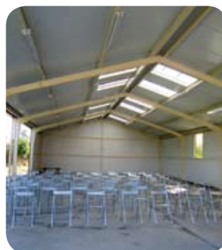
Coscojuela estrena equipamientos.