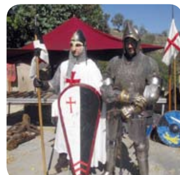
...Y Artasona regresa al medievo durante dos días.