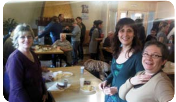
Los niños de el colegio de El Grado prepararon con esmero la "Operación bocata" de este año, destinada a obtener fondos para Manos Unidas. Hubo tapas en El Torno para atraer a vecinos y visitantes.

Nuevos tabloncillos de anuncios en las cuatro poblaciones. ¡Para que la información llegue a todos los rincones!