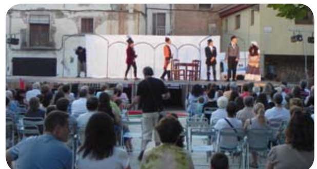
Los intereses creados, teatro en El Grado con el grupo La Meliguera.