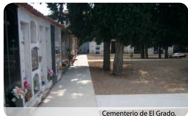
Cementerio de El Grado.