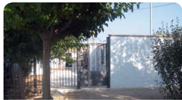
Cementerio de Enate.