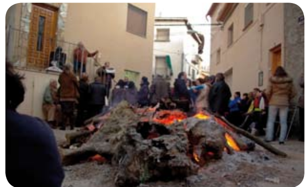
San Fabián y San Sebastián, chiretada, castañada, fiestas de verano... los vecinos de Artasona siempre encuentran motivo para reunirse y pasar un buen rato.