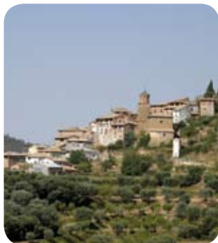
Ejecutada la primera fase de los riegos de Coscojuela.