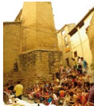
Ecos de las actividades culturales en el municipio.