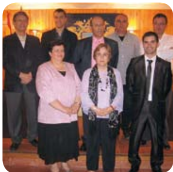
Nueva Corporación municipal.