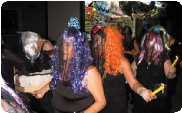
Disfraces para todos los gustos en las fiestas de El Grado.