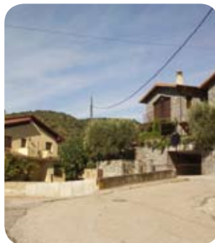
Se busca nombre para algunas calles de El Grado.