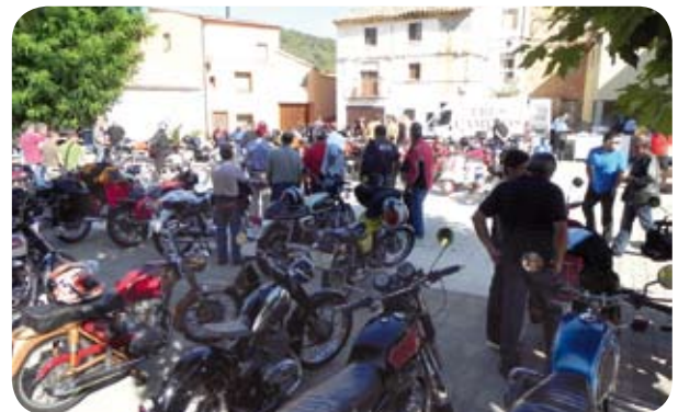
Un año más las motos antiguas de la provincia se congregaron en El Grado. En la plaza se pudieron ver modelos históricos.