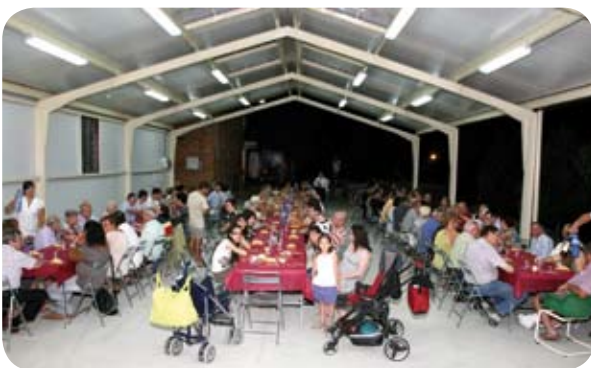
La cena de verano en Coscojuela, todo un clásico.