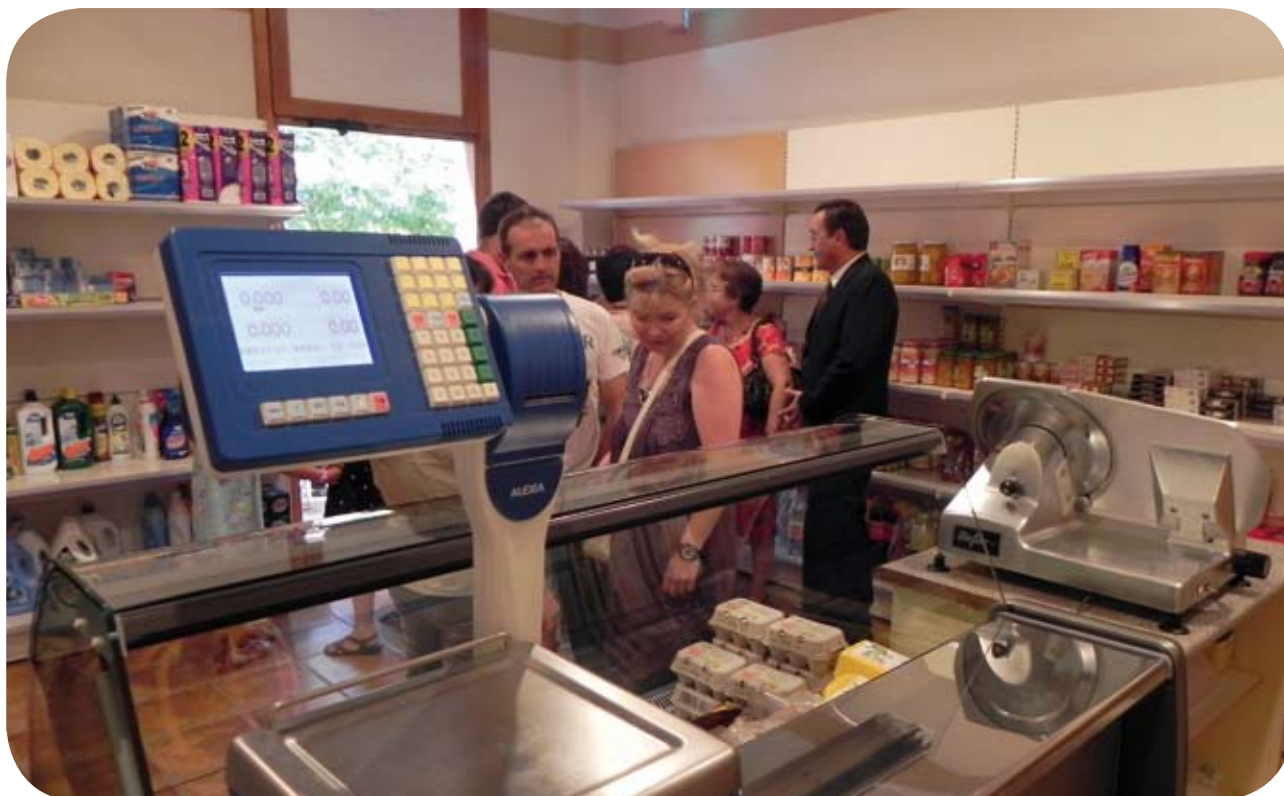
El Multiservicios de El Grado es ya una realidad.

ARTASONA - COSCOJUELA DE FANTOVA - EL GRADO - ENATE año 2012 - ENERO