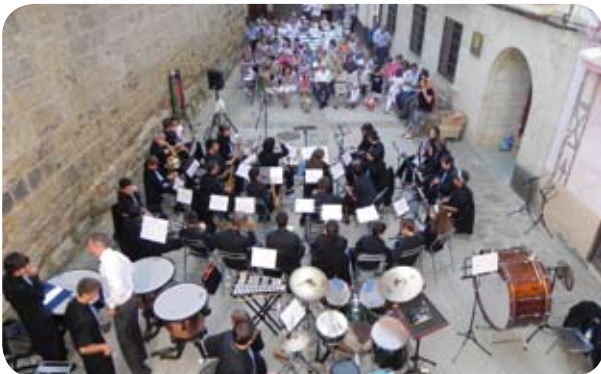
Actuación de la Banda Ciudad de Barbastro, invitada por la Asociación de Vecinos, en las fiestas de El Grado.