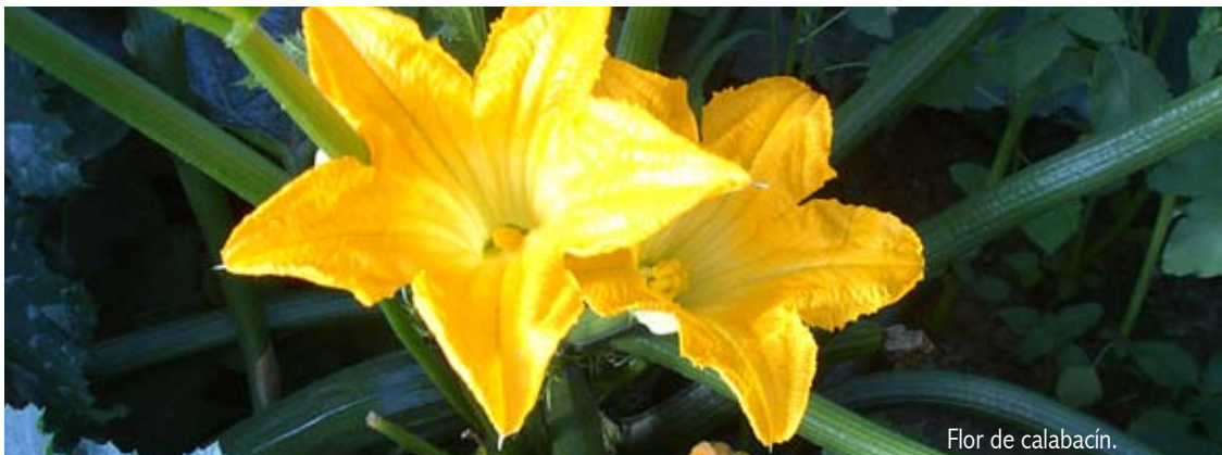
Flor de calabacín.

19 Fin de curso en el colegio. 24 Paseo de motos antiguas.