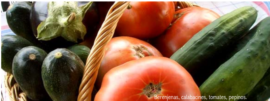
Berenjenas, calabacines, tomates, pepinos.

4 Fiesta local en Artasona. San Plácido. Fiestas en Artasona (del 3 al 5). 14 Cena de vecinos en Coscojuela de Fantova. 17 y 18 Verbenas del Turista. 18 Mundial del Parchís. Durante este mes, finalizan las actividades del "Verano Cultural".